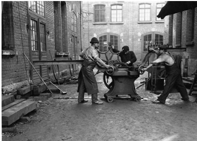
Magirus Arbeiter Arbeiter der Ulmer „Feuerwehrgeräte- und Kraftfahrzeugfabrik“ Magirus beim Biegen von Rahmenteilen, um 1900.