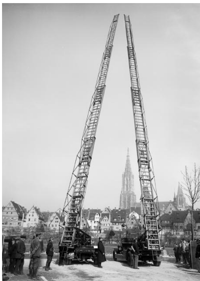
Magirus Leitern Feuerwehrdrehleitern von Magirus von 1928