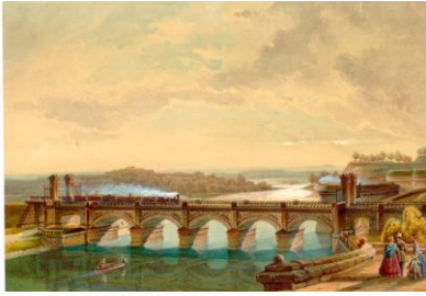
Eisenbahnbrücke Donau Eisenbahnbrücke über die Donau bei Ulm. Aquarellierte Bleistiftzeichnung, um 1855